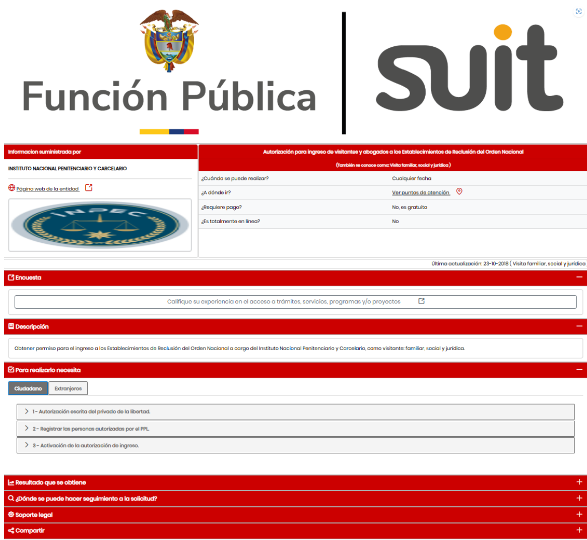
Figura 4. Captura de pantalla funcionamiento Trámite - Autorización para ingreso de visitantes y abogados a los Establecimientos de Reclusión del Orden Nacional