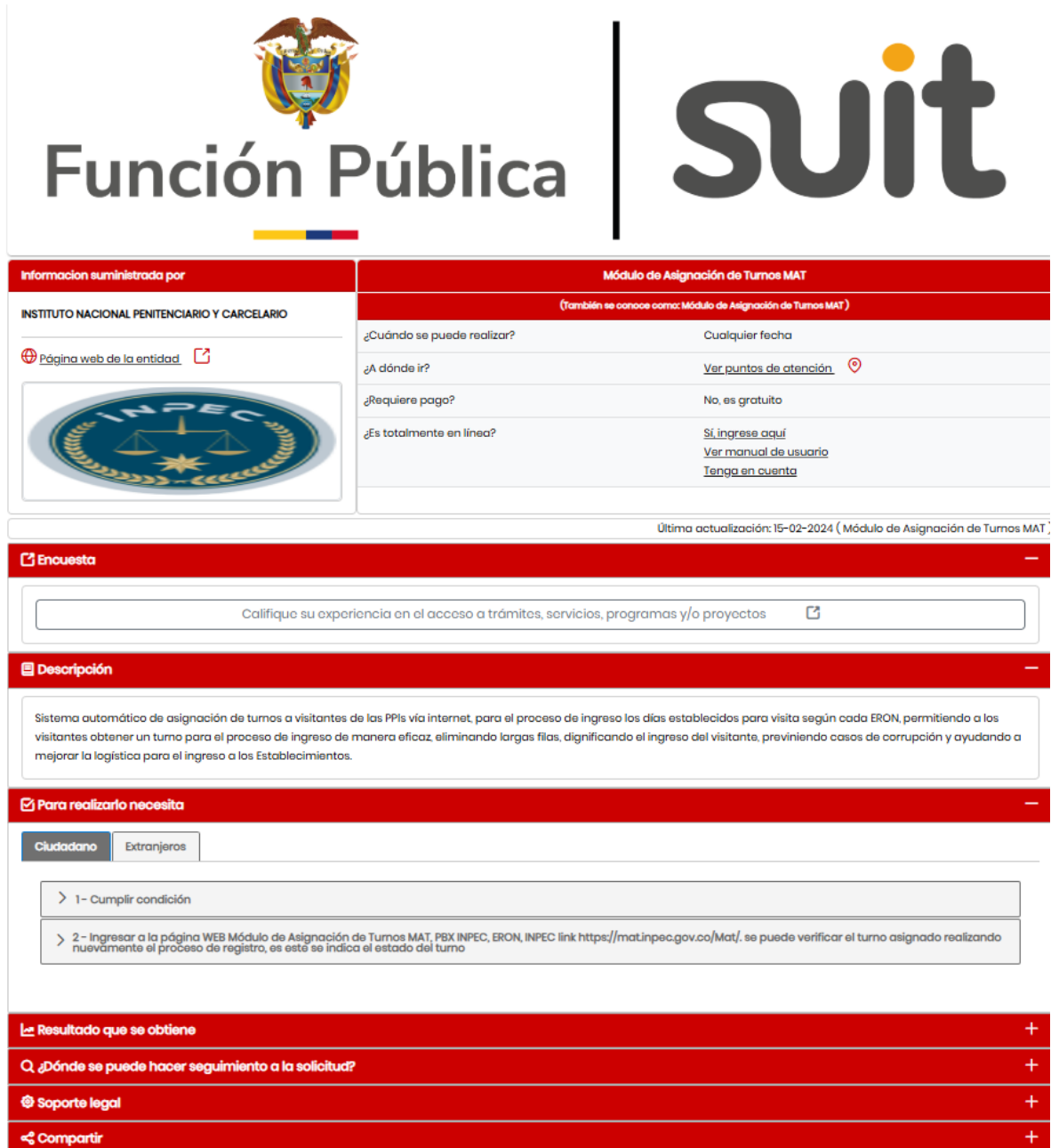
Figura 2. Captura de pantalla Funcionamiento OPA-MAT SUIT