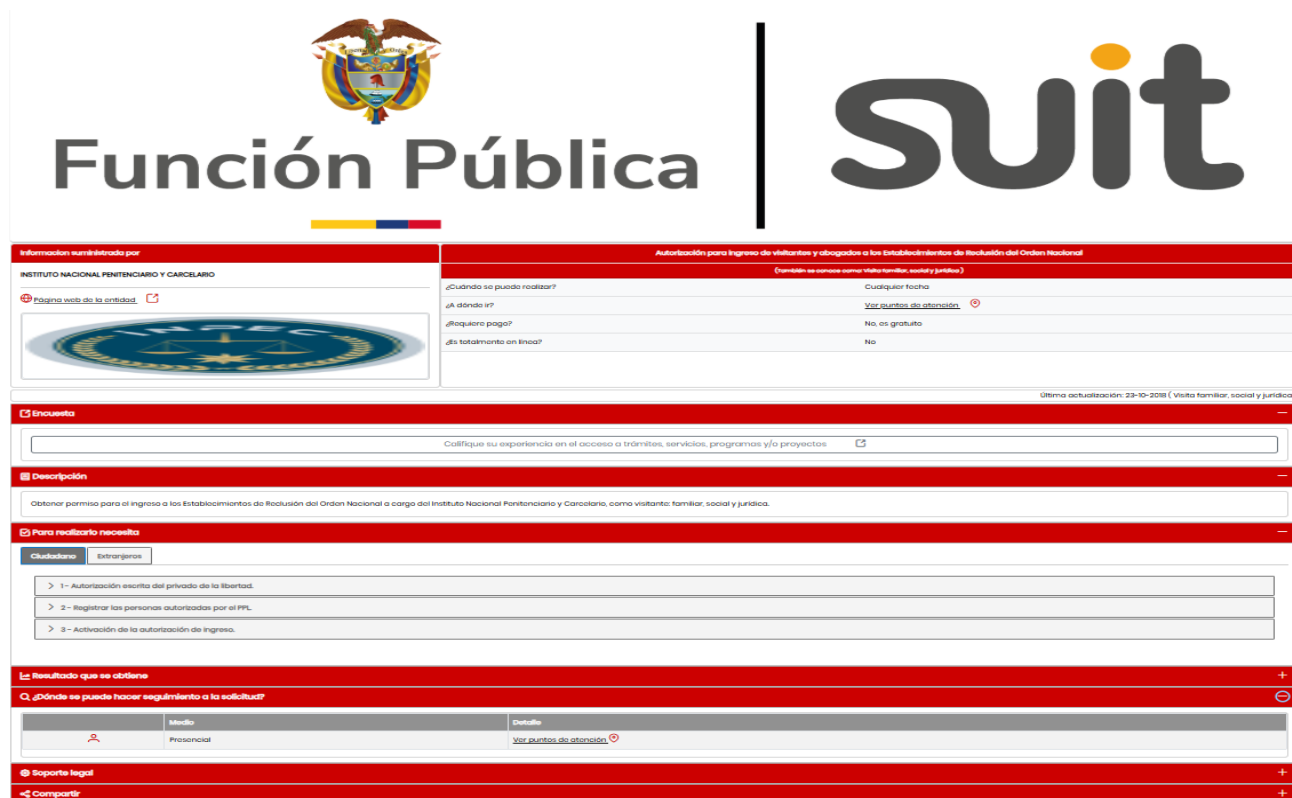
Figura 7. Tramite autorización para ingreso de visitantes y abogados a los ERON