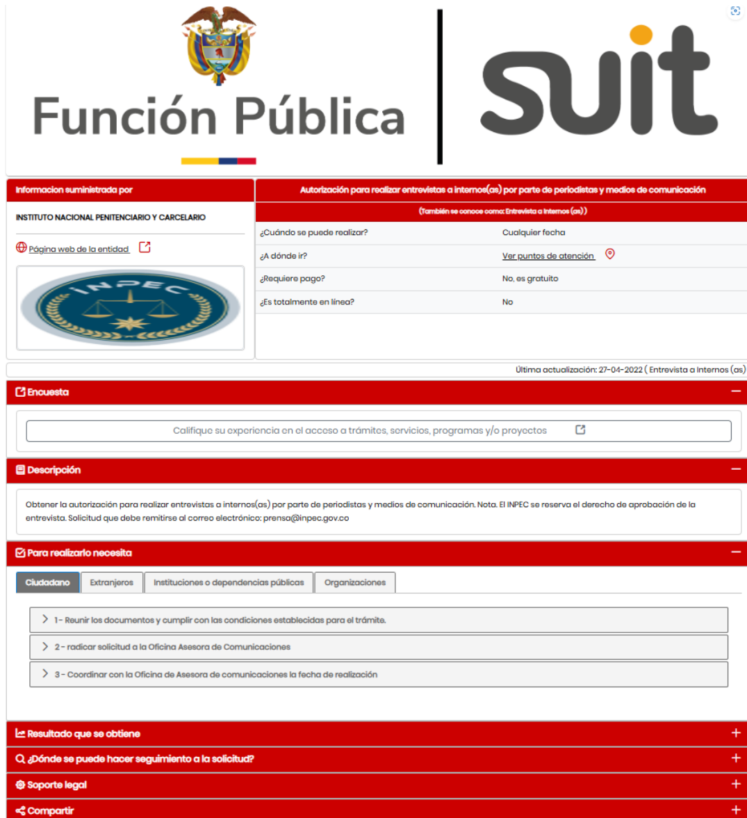
Figura 6. Captura de Pantalla Trámite autorización para realizar entrevista a internos(as)