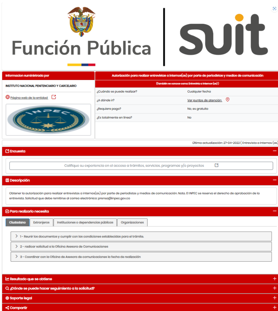
Figura 5. Captura de pantalla SUIT Trámite Autorización para realizar entrevistas a internos (as) por parte de periodistas y medios de comunicación