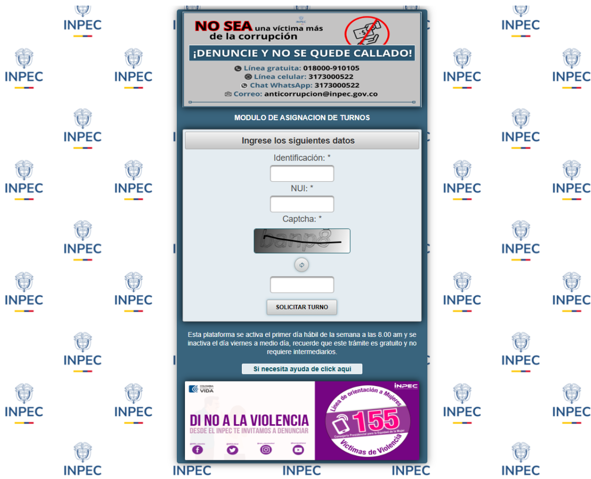
Figura 3. Captura de pantalla funcionamiento pagina web INPEC OPA-MAT

Fuente 5. Página web INPEC https://mat.inpec.gov.co/Mat/