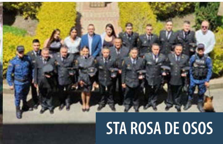
STA ROSA DE OSOS