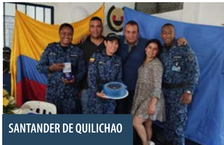
SANTANDER DE QUILICHAO