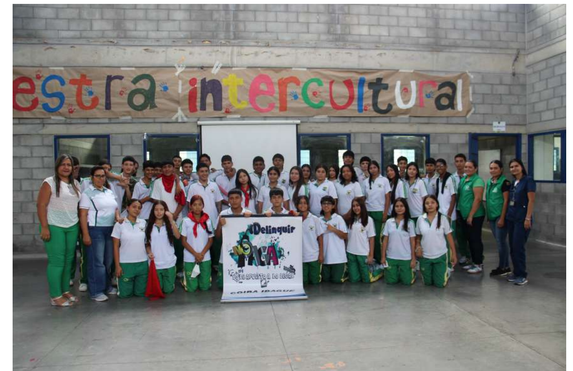
Complejo Carcelario y Penitenciario con Alta y Media Seguridad de Ibagué Picaleña

Los jóvenes que asisten y participan en el programa han concluido con un mensaje potente: “delinquir no es una opción”. Profesionales de psicología, Personal del Cuerpo de Custodia y Vigilancia y administrativo, apoyan las diferentes etapas del desarrollo del programa.