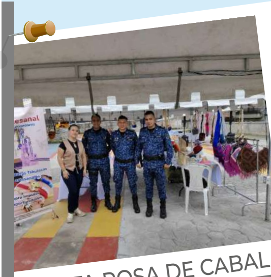
SANTA ROSA DE CABAL