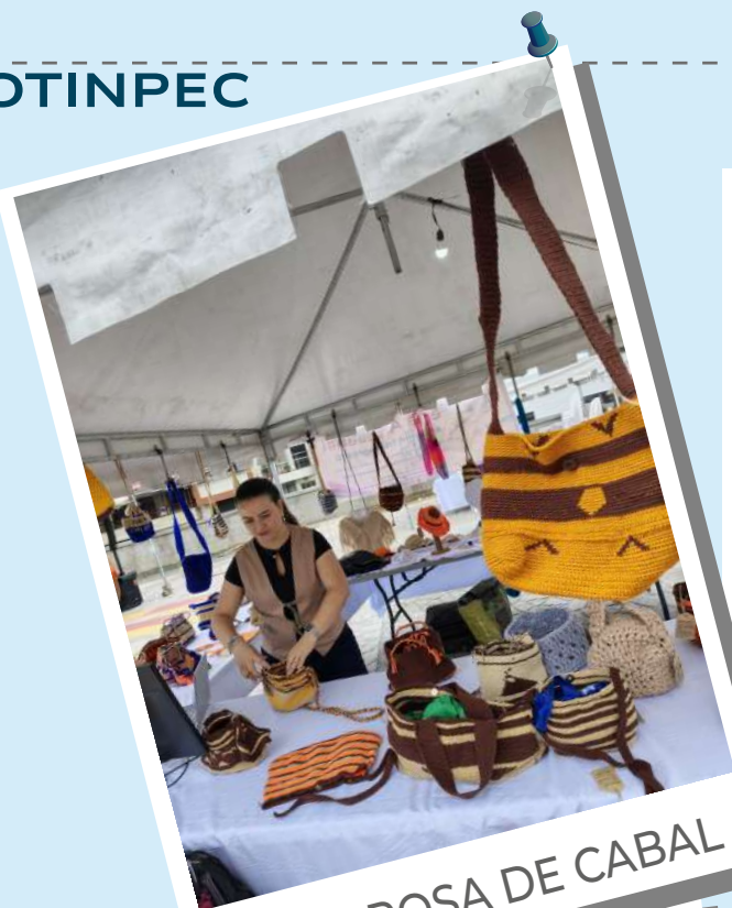
SANTA ROSA DE CABAL